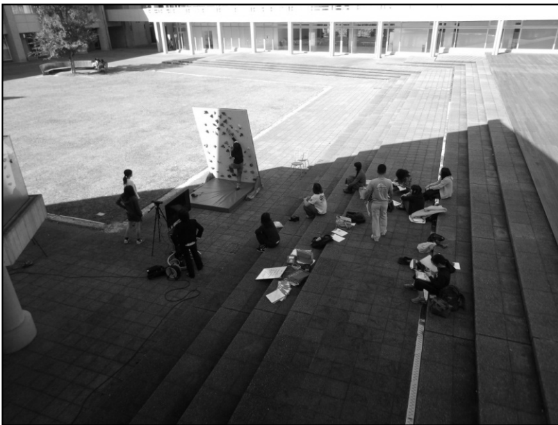
図1 ボルダリング体験会の様子